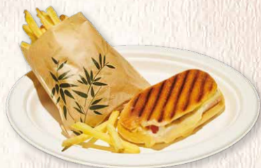
Mini cachorro com batatas fritas no forno Mini hot dog with oven chips