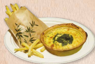
Quiche de legumes Vegetable quiche