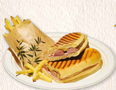
Cachorro Hot dog