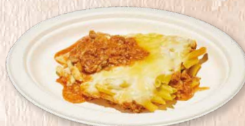
Macarrão bolonhesa Macaroni bolognese