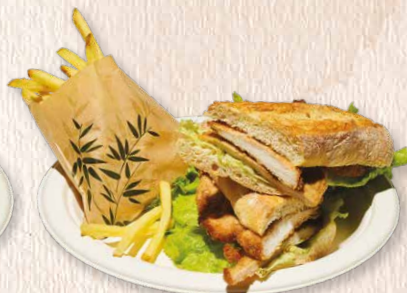
Sandes de panado Breaded chicken sandwich